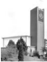
St. Maria Frieden

Vierter Advent - Weihnachten - Silvester - Neujahr – Taufe des Herrn 2023 / 2024