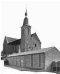
St. Johann/ St. Marien

Der zur Weihnacht geboren wurde, hat nicht auf Probe mit uns gelebt, ist nicht auf Probe für uns gestorben, hat uns nicht auf Probe geliebt. Er ist da Ja und sagt das Ja, ein ganzes, unwiderrufliches göttliches Ja zu uns, zur Menschheit, zur Welt.