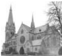
St. Peter und Paul