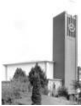
St. Maria Frieden